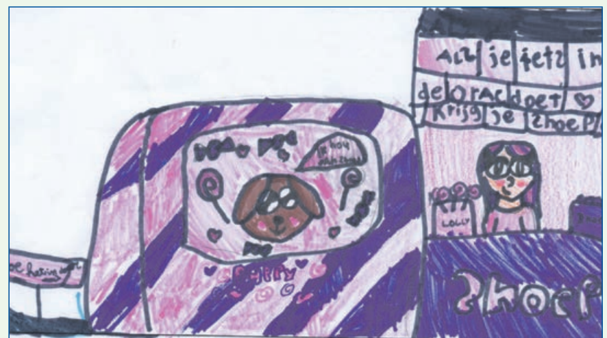
Als je hier iets in doet krijg je een snoepje: helemaal gratis lekker snoepen. Nur, 9 jaar