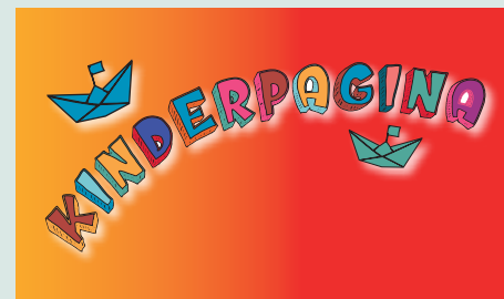
Extra kinderpagina > pag. 15