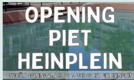
Opening Piet Heinplein > pag. 8