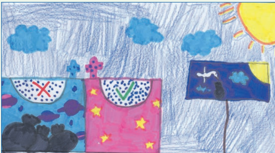
Deze afvalcontainers zijn heel handig, want als er afval vóór staat, dan komt er een rood kruis op. Als er geen afval voor of naast staat komt er een groen vinkje. Super handig en er staat een bord naast van wat de gevolgen zijn. Charlotte, 9 jaar