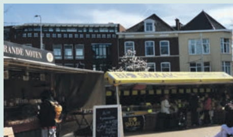
Zorgen over biologische markt > pag. 2