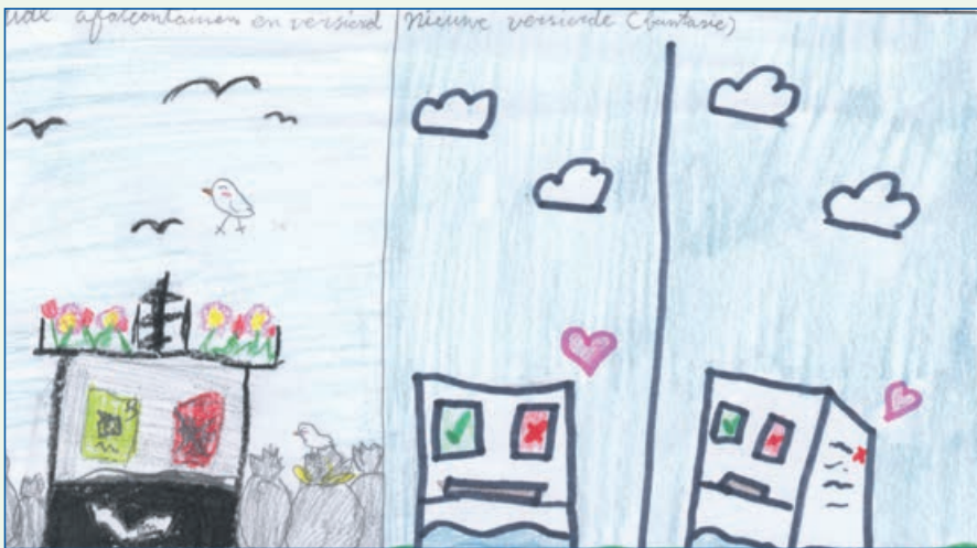
Ik heb een afvalcontainer gemaakt met een zee er op en aan de zijkant staat dat je er geen afval naast mag zetten. Alana, 9 jaar

De opdracht was: Mensen zetten soms rommel naast de ondergrondse afvalcontainer. Versier de afvalcontainer!