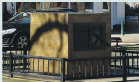
Sinti- en Romamonument > pag. 6