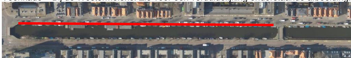
Parkeerverbod waterzijde Veenkade 13 t/m 17 maart 2023

Voor het aan- en afvoeren van de kraan, die de funderingspalen aanbrengt, zijn extra grote transporten nodig. Om die reden is het vanaf maandag 13 maart tot en met vrijdag 17 maart niet mogelijk gebruik te maken van de parkeerplaatsen aan de waterzijde van de Veenkade tussen de kruising Veenkade – Hemsterhuisstraat en de kruising Veenkade – Bij de Westermolens. Zie voor een verduidelijking onderstaande afbeelding.